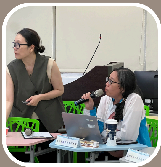
南港高中師長分享