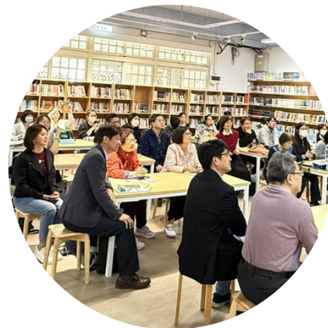
北市閱推夥伴熱情 參與並專注聆聽