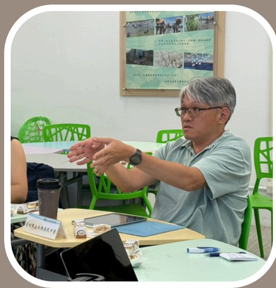
內湖國中師長分享