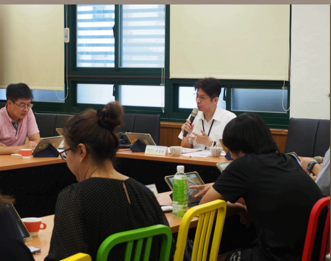
教育局督學佈達事項