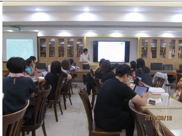
詹士宜教授補充說明造成學生閱讀動機不佳的主要原因