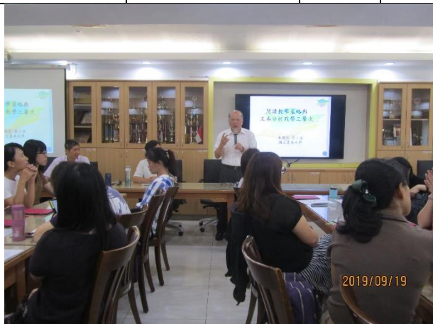
校長致詞研習會場