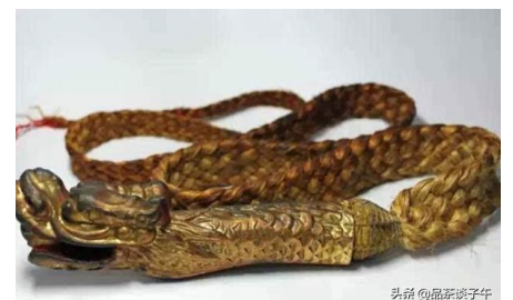
圖三：太上老君的晃金繩