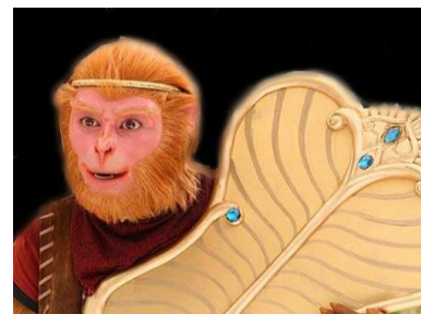
圖一：孫悟空借芭蕉扇

不一會兒功夫，悟空就回到災難現場，用借來的扇子輕輕一搨，一陣大風吹過，燒了三天三夜的大火終於熄滅了。這陣大風也讓森林邊忙著救火的消防隊員們看得目瞪口呆，渾然不知是赫赫有名的齊天大聖出手相助啊！